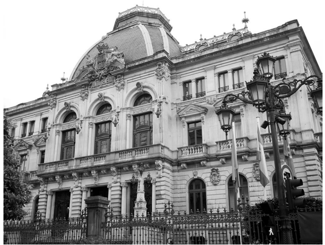
El Parlamento de Asturias

El asturiano, también conocido como el bable, no se reconoce como lengua oficial en España pero ya es “oficial” en el Parlamento de Asturias.